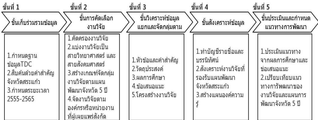
แผนภาพที่ 1 กระบวนการดำเนินงานวิจัย