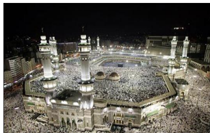
ภาพประกอบที่ 1 : มัสยิดอัล-หะรอม ณ นครมักกะฮฺ

ประวัติศาสตร์อิสลาม และการศึกษาอิสลาม มักกะฮฺเป็นที่ตั้งของวิหารกะอเบฮฺ สถานที่ที่มุสลิมผินหน้าไปขณะละหมาด 5 เวลา และสถานที่ประกอบศาสนกิจสำคัญ คือ ฮัจญ์และอุมเราะฮฺ สถานที่อันเป็นจุดเริ่มต้นการเผยแผ่ศาสนาอิสลามในยุคศาสดามุฮัมมัด ศอลันลอฮฺอูลัยฮิวะสลัม ขณะที่มะดีนะฮฺเป็นที่ตั้งของมัสยิดศาสดา (Masjid Nabawi) ศูนย์กลางการบริหารจัดการบ้านเมืองในยุคของศาสดามุฮัมมัด ศอลันลอฮฺอูลัยฮิวะสลัม และศูนย์กลางประสานความร่วมมือระหว่างชนเผ่าที่แตกต่างกันและหล่อหลอมเป็นเอกภาพภายใต้ธงผืนเดียวกัน คือ ธงแห่งอิสลาม ที่ได้สร้างสมานฉันท์กับชนศาสนิกอื่นๆ ทั้งยูดาเย คริสต์ และโซโรแอสเตอร์ มะดีนะฮฺเป็นโมเดลหลักในการปกครองของราชอาณาจักรมุสลิมในยุคต่อๆ มา