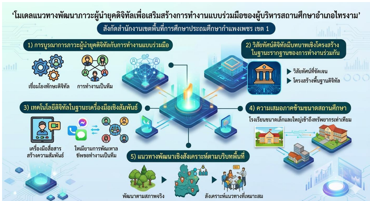
ภาพที่ 1 กรอบแนวทางพัฒนาภาวะผู้นำยุคดิจิทัลเพื่อเสริมสร้างการทำงานแบบร่วมมือของผู้บริหารสถานศึกษาอำเภอไทรงาม สังกัดสำนักงานเขตพื้นที่การศึกษาประถมศึกษากำแพงเพชร เขต 1

การพัฒนาภาวะผู้นำยุคดิจิทัลควรเริ่มจากการสร้าง วิสัยทัศน์ร่วมผ่านกลไกดิจิทัลก่อนการพัฒนาเครื่องมือหรือแพลตฟอร์มเทคโนโลยี 3) เทคโนโลยีดิจิทัลในฐานะเครื่องมือเชิงสัมพันธ์เทคโนโลยีทำหน้าที่เสริมสร้างความไว้วางใจ การมีส่วนร่วม และความผูกพัน มากกว่าการเป็นเพียงเครื่องมือด้านเทคนิค ผู้บริหารที่ใช้เทคโนโลยีในการสื่อสาร วางแผน และประเมินผลอย่างต่อเนื่อง สามารถสร้างบรรยากาศการทำงานแบบร่วมมือได้อย่างชัดเจน 4) ความเสมอภาคข้ามขนาดสถานศึกษา ไม่พบความแตกต่างตามขนาดโรงเรียนอย่างมีนัยสำคัญ แสดงว่าภาวะผู้นำยุคดิจิทัลพัฒนาได้ในทุกบริบท จึงควรมุ่งพัฒนาทัศนคติและกระบวนการบริหารมากกว่าข้อจำกัดด้านทรัพยากร และ 5) แนวทางพัฒนาเชิงสังเคราะห์ตามบริบทพื้นที่ เสนอกรอบพัฒนาที่บูรณาการ 5.1) ทักษะดิจิทัล 5.2) การสื่อสารและการทำงานเป็นทีม และ 5.3) ภาวะผู้นำเชิงเปลี่ยนแปลง ซึ่งสามารถใช้เป็นแนวทางกำหนดนโยบายและพัฒนาผู้บริหารในยุคดิจิทัลได้อย่างเป็นรูปธรรม