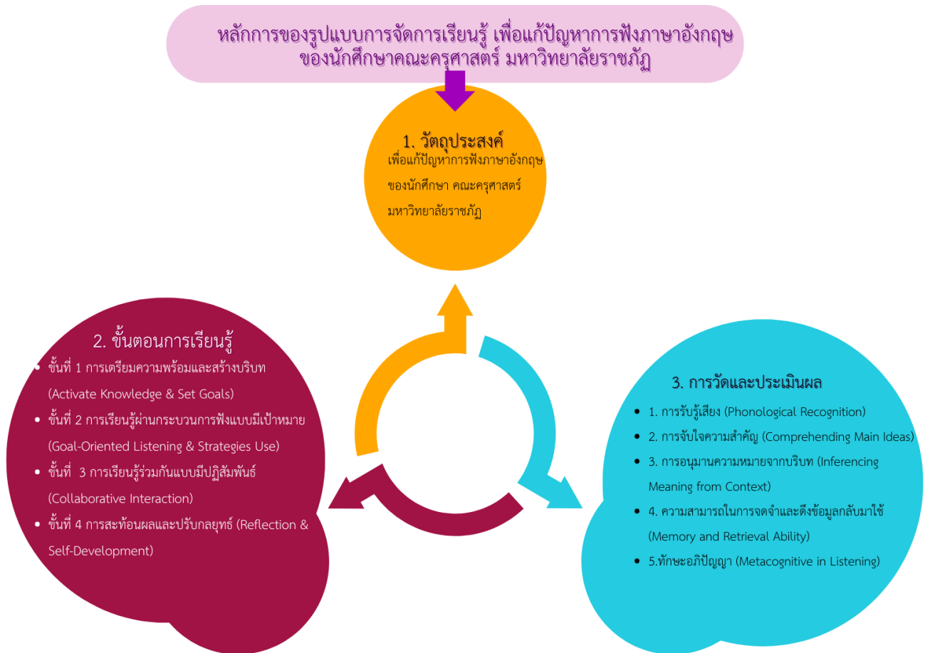
ภาพที่ 4 แผนภาพแสดงองค์ประกอบของรูปแบบการจัดการเรียนรู้เพื่อแก้ปัญหาการฟังภาษาอังกฤษฯ