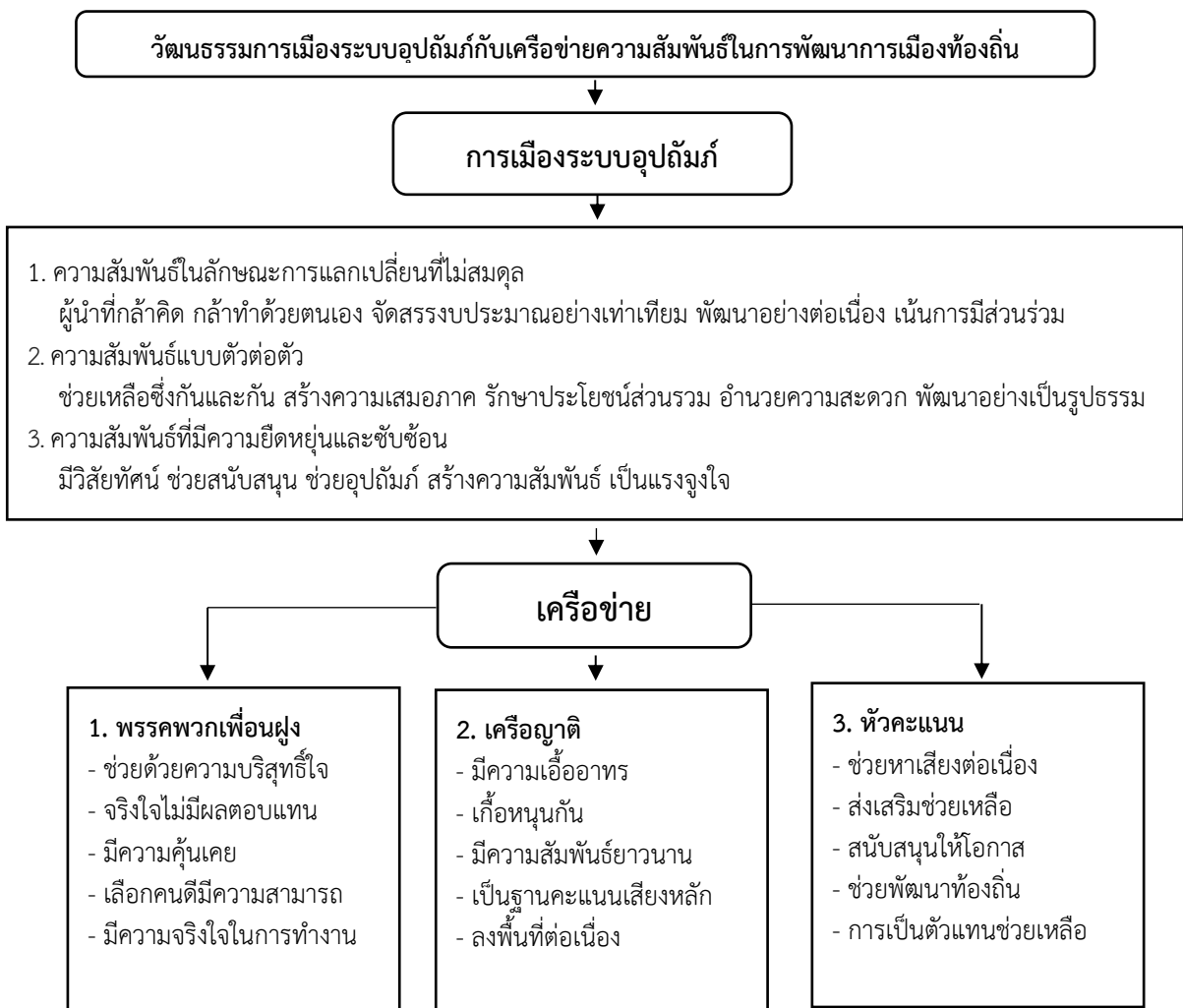
ภาพที่ 1 โมเดลวัฒนธรรมการเมืองระบบอุปถัมภ์ในจังหวัดนครราชสีมา

คนรุ่นใหม่ในชุมชนให้รับรู้และเข้าใจถึงหลักการประชาธิปไตยอย่างถูกต้อง โดยเริ่มจากสถาบันครอบครัวเอาใจใส่ดูแลและอบรมบุตรหลานของตนให้มีอุปนิสัยเอื้อต่อการเป็นประชาชนที่ดีตามระบอบประชาธิปไตย (พงษ์เมธี ไชยศรีหา, 2561) จากนั้นสถาบันทางการศึกษาทำหน้าที่ในการถ่ายทอดหลักการทฤษฎีที่ถูกต้องทั้งในระบบห้องเรียนและกิจกรรมภายในโรงเรียน และสุดท้ายสถาบันทางการเมืองทำหน้าที่ทั้งในการให้ความรู้และเปิดช่องทางให้ประชาชนได้ทราบถึงกิจกรรมต่าง ๆ ที่ทางสถาบันทางการเมืองในแต่ละประเภทดำเนินการ ทั้งนี้หากทั้งสามสถาบันดำเนินการได้ครบถ้วน การพัฒนาประชาธิปไตยภายในชุมชนก็จะเป็นไปโดยง่าย และสอดคล้องกับงานวิจัยของ ชาญชัย ฮวดศรี ได้วิจัยเรื่อง “รูปแบบการส่งเสริมวัฒนธรรมทางการเมืองเชิงพุทธของผู้นำชุมชนจังหวัดขอนแก่น” ผลการวิจัยพบว่า การส่งเสริมวัฒนธรรมทางการเมืองของผู้นำชุมชนในจังหวัดขอนแก่น ผู้นำ ชุมชน และพระสงฆ์เป็นผู้ที่ได้รับการยอมรับจากประชาชนในชุมชนและมีอิทธิพลต่อการตัดสินใจใน การมีส่วนร่วมทางการเมือง การชักจูงโน้มน้าวให้ประชาชนในชุมชนไปใช้สิทธิในการเลือกตั้ง รูปแบบการส่งเสริมวัฒนธรรมทางการเมืองเชิงพุทธของผู้นำชุมชน คือการใช้หลักธรรมใน การส่งเสริมวัฒนธรรมการเมือง (ชาญชัย ฮวดศรี, 2558) ดังนี้ 1) การเลือกตั้งใช้หลักหลักกคต 4 และธรรมคัมภีร์ครองโลก 2) การรณรงค์หาเสียงใช้หลักกอธิปไตย 3) การมีส่วนร่วมในกิจกรรมทางการเมืองใช้หลักหลักสาราณียธรรม 6) และบทบาทของผู้นำชุมชนในการกำหนดนโยบายใช้หลักอภิธานียธรรม 7