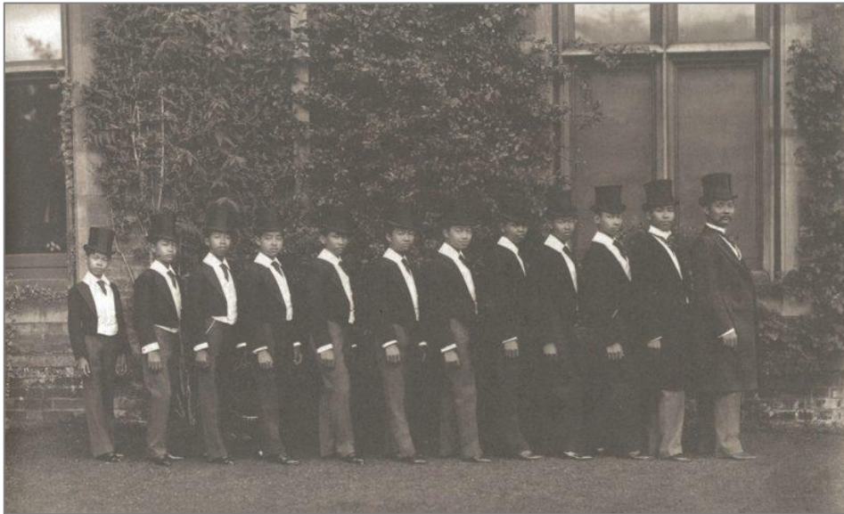
ภาพที่ 3 พระบาทสมเด็จพระจุลจอมเกล้าเจ้าอยู่หัว ทรงฉายร่วมกับพระราชโอรสที่ทรงศึกษาวิชาการอยู่ในยุโรป เมื่อคราวเสด็จประพาสยุโรปครั้งที่ 1 พ.ศ. 2440 (ศิลปวัฒนธรรม, 2564)

พิจารณาร่วมกันในเรื่องปัจจัยทางสังคมที่ส่งผลต่อแนวความคิดในการสร้างสรรค์ผลงานทรงออกแบบทางศิลปะ ในสมเด็จพระเจ้าฟ้ากรมพระยานริศรานุวัดติวงศ์ จากบทความนี้นำเสนอประเด็นสำคัญในการไขว่คว้าต้องการความ “ศิวิไลซ์” เป็นความพยายามของชนชั้นนำในการปรับอัตลักษณ์ของตนเองเพื่อให้บรรลุสถานะสูงสุดภายใต้สำนึก กาลเทศะและระเบียบโลกใหม่ในความรู้ของสยามเองในขณะนั้นที่มียุโรปเป็นศูนย์กลาง