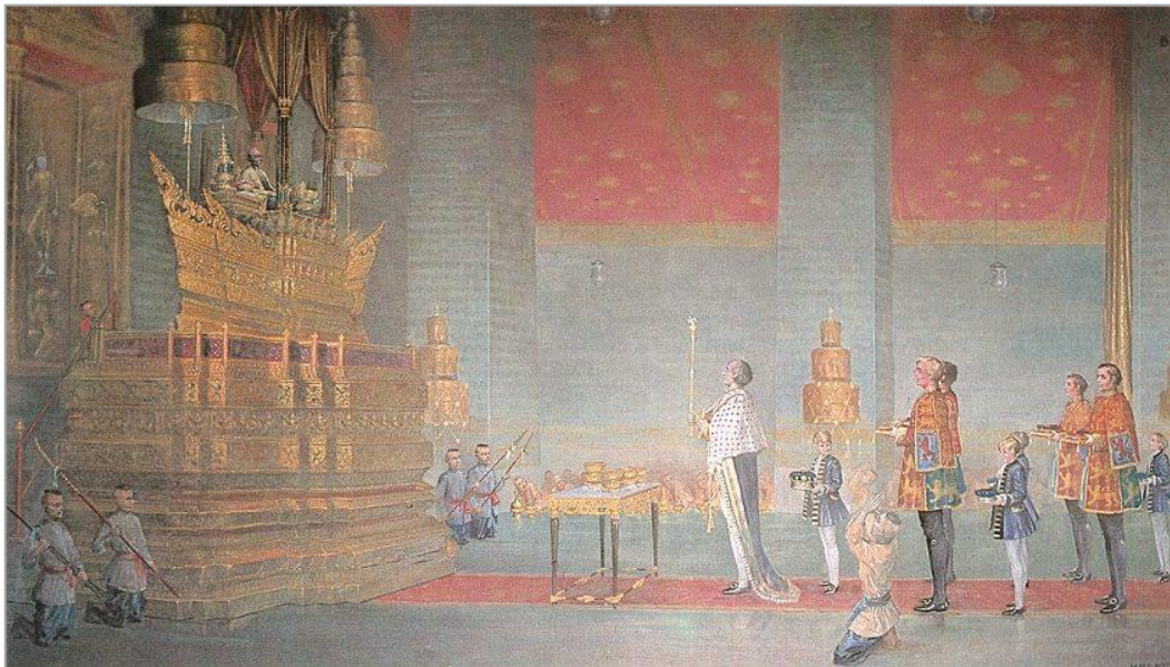
ภาพที่ 1 พระบาทสมเด็จพระจอมเกล้าเจ้าอยู่หัว โปรดเกล้าฯ ให้เซอร์จอห์น เบาริ่ง อัครราชทูตอังกฤษ เข้าเฝ้า (ภาพจิตรกรรมเทิดพระเกียรติกษัตริย์แห่งพระบรมราชจักรีวงศ์ วาดโดย นคร หุราพันธ์ ปัจจุบันแขวนอยู่ภายในอาคารรัฐสภา) (ไกรฤกษ์ นานา, 2564)

มักให้ความสนใจในการคุกคามต่อเอกราชและความอยู่รอดบนสิทธิอาณาเขตของสยาม แต่อีกมุมหนึ่งก็เปลี่ยนแปลงอย่างมหาศาล คือ การปรับตัวน้อมรับกับแรงปะทะทางศิลปวัฒนธรรม อันส่งผลหลายประการต่อกระแสสุนทรียะและรสนิยมที่มีมาแต่เดิมของชนชั้นนำและผู้คนในขณะนั้น และสิ่งที่เป็นประจักษ์พยานที่เด่นชัดมากที่สุด ในสถานการณ์นี้ คือ “สนธิสัญญาเบาริ่ง” ระหว่างอังกฤษกับสยามจึงเกิดขึ้นเมื่อวันที่ 18 เมษายน พ.ศ. 2398 (ค.ศ. 1855) ประกอบด้วยข้อตกลง 21 ข้อ เนื้อหาของสัญญาเป็นความเข้าใจทางพระราชไมตรีและการกำหนดระเบียบใหม่ทางเศรษฐกิจ ได้แก่ การค้าเสรี การจัดเก็บภาษี สิทธิสภาพนอกอาณาเขต และสิทธิมนุษยชน (ไกรฤกษ์ นานา, 2555) การเกิดขึ้นของสนธิสัญญารั้งนี้ เป็นสนธิสัญญาพลิกแผ่นดิน ถือเป็น “กุญแจเปิดประตูสู่สยาม” ที่ทิ้งมรดกในการเปลี่ยนแปลงทางเศรษฐกิจ การเมือง สังคมและวัฒนธรรมไว้จนถึงปัจจุบันขณะนี้และยังสามารถส่งต่อไปได้ถึงอนาคต