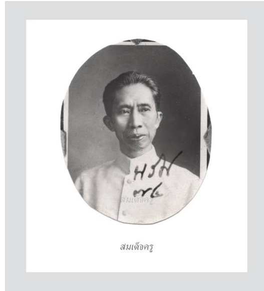
ภาพที่ 2 สมเด็จพระเจ้าบรมวงศ์เธอ เจ้าฟ้ากรมพระยานริศรานุวัดติวงศ์ หรือ “สมเด็จพระครู” (สมเด็จพระครู, 2564)

รู้อยู่ในปัจจุบัน พระปรีชาสามารถในเชิงศิลปะของพระองค์ท่านนั้น พระบาทสมเด็จพระจุลจอมเกล้าเจ้าอยู่หัว ถึงกับทรงมีพระราชหัตถเลขาวิจารณ์ไว้อย่างลึกซึ้ง เมื่อได้ทอดพระเนตรสถาปัตยกรรมพระอุโบสถวัดเบญจมบพิตร ที่สมเด็จพระครูทรงออกแบบและควบคุมการก่อสร้างจนแล้วเสร็จว่า “งามนัก... ฉันไม่ได้นึกจะยอเลยแต่อดไม่ได้ ว่า เธอเป็นผู้นั่งอยู่ในหัวใจของพระองค์เสียแล้ว ในเรื่องทำดีเช่นนี้” (ม.ร.ว. โต จิตรพงศ์, 2493)บรรดาพระบรมวงศานุวงศ์ทั้งหลายทั้งปวง ต่างถวายสมัญญนามอย่างชื่นชมยกย่องว่า พระองค์เป็น “นายช่างใหญ่แห่งกรุงสยาม” สถาปนิกและช่างศิลป์ต่าง ๆ ผู้เป็นศิษย์เรียกพระองค์ท่านว่า “สมเด็จพระครู”