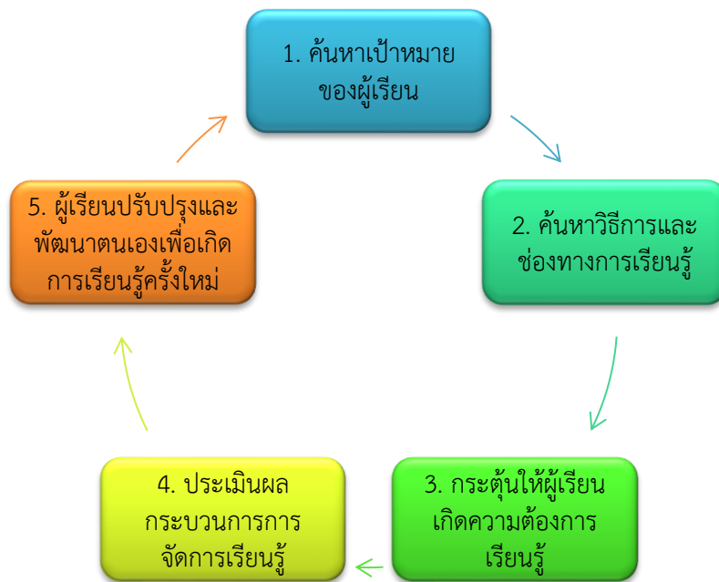
ภาพที่ 2 การจัดการเรียนรู้ในยุคความปกติใหม่

โดยการจัดการเรียนรู้ในยุคความปกติใหม่นั้น ความเปลี่ยนแปลงไปจากเดิมอย่างชัดเจนที่สุด ได้แก่ เรื่องสถานที่ จากเดิมที่ผู้เรียนต้องเดินทางเรียนที่ไปโรงเรียนต้องเปลี่ยนแปลงเป็นการเรียนออนไลน์แทน โดยผู้เรียนสามารถเรียนได้ทั้งที่บ้าน และสถานที่อื่นๆ ไม่มีความจำเป็นต้องเดินทาง (กาญจนา บุญภักดี, 2563) ซึ่ง พัชราภรณ์ ดวงชื่น ได้กล่าวถึงรูปแบบเรียนในยุคความปกติใหม่ มีรายละเอียด (พัชราภรณ์ ดวงชื่น, 2563) ดังนี้