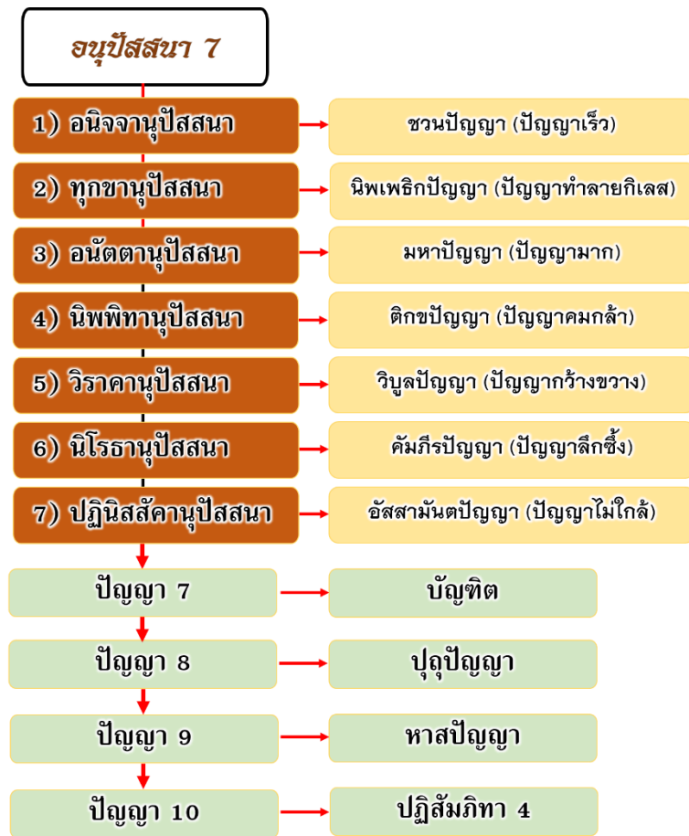
ภาพที่ 1 รูปแบบของปัญญาพิจารณาถูกรอบด้วยหลักอนุปัสสนา 7 ประการ

โดยการพิจารณาเห็นตามหลักอนุปัสสนา 7 คือ ความไม่เที่ยง ความเป็นทุกข์ ความเป็นอนัตตา ความเปื้อนหน่าย ความคลายกำหนด ความดับสูญ และความสลละคืน ย่อมทำให้เข้าถึงการพิจารณาแต่ละประเภท คือ ขวนปัญญาที่แล่นไปช้าแรกกิเลสโดยลำดับ (ช.ป. (ไทย) 31/1/537-540) (มหาจุฬาลงกรณราชวิทยาลัย, 2539) ดังปรากฏตาม ภาพที่ 1