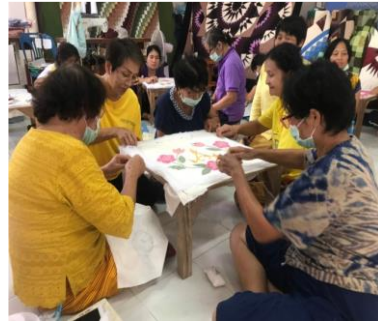
ภาพที่ 2 สร้างผลิตภัณฑ์ผ้าต้นมือ

กิจกรรมที่ 4 การคัดเลือกผลงาน เป็นกิจกรรมที่คัดเลือกผลงานที่มีความคิดสร้างสรรค์สวยงาม นำไปสู่การยกระดับรายได้สู่เศรษฐกิจชุมชน ซึ่งมีเกณฑ์ที่ใช้พิจารณาคือ รูปแบบผลงาน การนำไปใช้ประโยชน์ ความทันสมัย ความละเอียด ความประณีต ความสวยงามของผลิตภัณฑ์ ได้ผลงานสำเร็จรูป