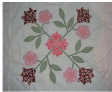
ภาพที่ 1 งานศิลปะสร้างสรรค์บนผ้าด้านมือ

กิจกรรมที่ 3 สร้างผลิตภัณฑ์ เป็นกิจกรรมที่เน้นการลงมือปฏิบัติจริงโดยกำหนดประเภทของผลิตภัณฑ์ผ้าด้านมือ ที่ให้กลุ่มเป้าหมายออกแบบและปฏิบัติ เช่น ของใช้ในชีวิตประจำวัน เครื่องประดับ เครื่องนุ่งห่ม เพื่อให้ได้ผลิตภัณฑ์ที่สามารถนำมาใช้ประโยชน์และ