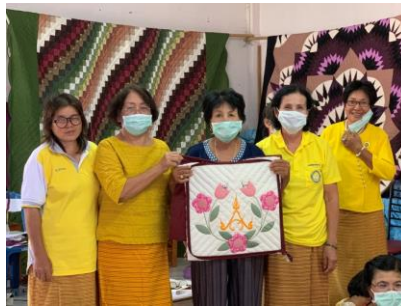
ภาพที่ 3 การคัดเลือกผลงานศิลปะเชิงสร้างสรรค์ผ้าต้นมือ

กิจกรรมที่ 4 การคัดเลือกผลงาน เป็นกิจกรรมที่คัดเลือกผลงานที่มีความคิดสร้างสรรค์สวยงาม นำไปสู่การยกระดับรายได้สู่เศรษฐกิจชุมชน ซึ่งมีเกณฑ์ที่ใช้พิจารณาคือ รูปแบบผลงาน การนำไปใช้ประโยชน์ ความทันสมัย ความละเอียด ความประณีต ความสวยงามของผลิตภัณฑ์ ได้ผลงานสำเร็จรูป