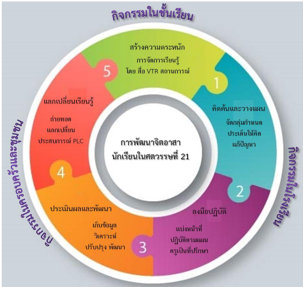
ภาพที่ 1 โครงสร้างการพัฒนาจิตอาสา นักเรียนในศตวรรษที่ 21

“มโนปุพพงคมา ธมฺมา มโนเสฏฐา มโนมยา มนสา เจ ปทุฏฐเณ ภาสตี วา กโรตี วา ตโต นํ ทุกขมนเวติ จกํ ว วหโต ปทํ “