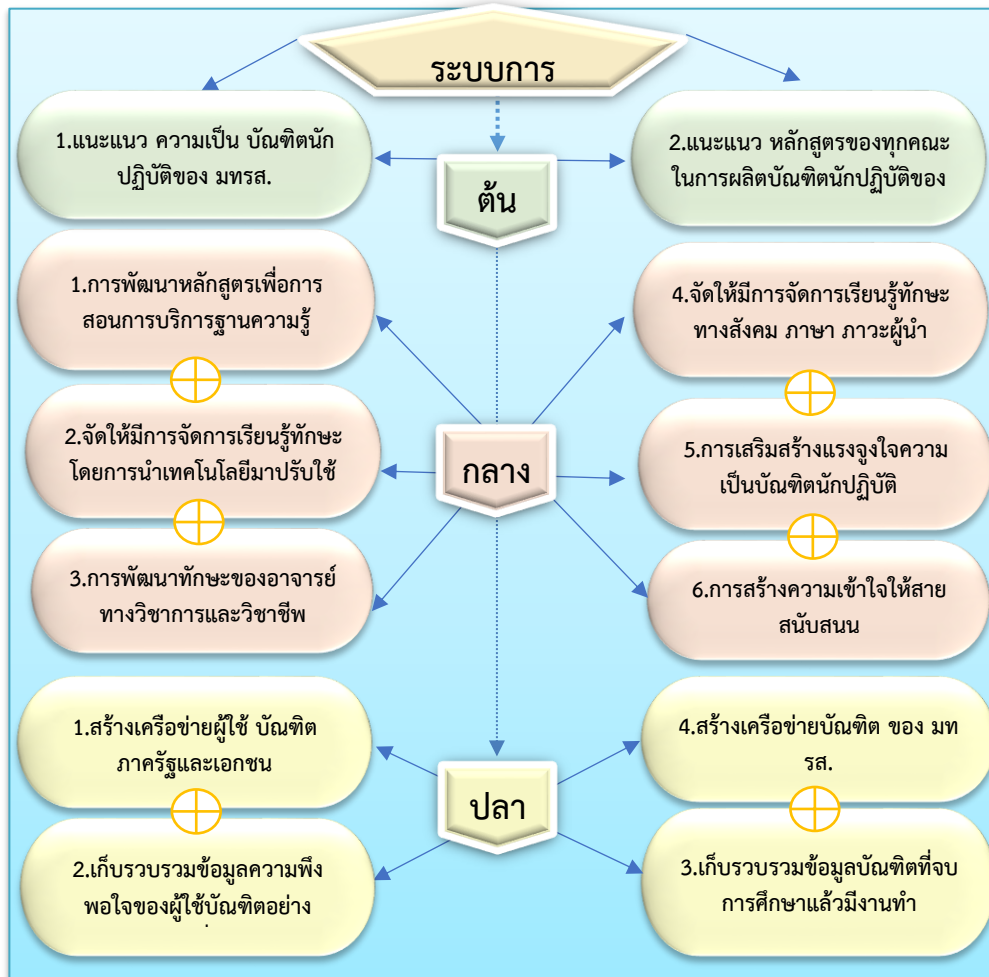
แผนภาพที่ 1 กระบวนการพัฒนาทักษะทางสังคมของบัณฑิตนักปฏิบัติด้านบริการฐานความรู้

วัตถุประสงค์ที่ 3 รูปแบบการพัฒนาทักษะทางสังคมของบัณฑิตนักปฏิบัติ ด้านบริการ ฐานความรู้ของมหาวิทยาลัยเทคโนโลยีราชมงคลสุวรรณภูมิ