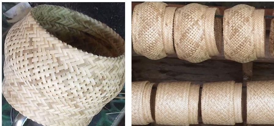
ภาพที่ 6 ตัวอย่างมวนึ่งข้าวและกระติบข้าว (ลายขัด)