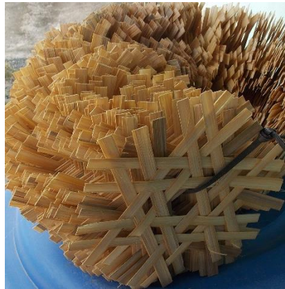
ภาพที่ 7 ตัวอย่างเข่งปลาทุ (ลายทแยง)

1.3.2 ลายทแยง ลักษณะการสานคล้ายการถัก ส่วนมากใช้ตอกเส้นแบนและบาง โครงสร้างของลายทแยงไม่มีเส้นตั้งหรือเส้นนอนเหมือนลายขัด เป็นลายสานที่ต้องการผิวเรียบบางสามารถสานต่อเชื่อมกันไปตามความโค้งของภาชนะที่ต้องการได้ เครื่องจักสานที่สานด้วยลายทแยงนี้ส่วนมากจะสามารถทรงรูปอยู่ได้ด้วยตัวเอง แต่ความแข็งแรงจะไม่ทนเท่าลายขัด มักใช้สานภาชนะโปร่ง เช่น เข่ง ชะลอม หรือใช้สานประกอบกับลายอื่น ในภาคตะวันออกเฉียงเหนือมีการใช้ลายลักษณะนี้ทำเข่งปลาทุ ซึ่งภาษาถิ่นเรียกว่า “ลายตาแหลว”