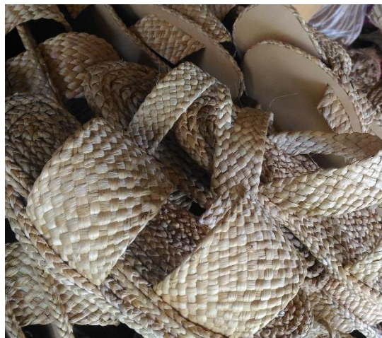
ภาพที่ 8 ตัวอย่างการสานรองเท้าผักตบชวา (ลายถัก)

1.3.3 ลายขัดหรือถัก ลายสานแบบขดส่วนมากจะใช้สานภาชนะโดยสร้างรูปทรงขึ้นด้วยการขดของวัสดุซ้อนเป็นชั้น ๆ แล้วใช้ตัวกลางเชื่อมถักเข้าด้วยการเย็บ ถัก หรือมัด ลายสานแบบขด ซึ่งใช้กับวัสดุที่ไม่สามารถคงรูปอยู่ได้ด้วยตัวเอง เช่น หวาย ผักตบชวา ลายสานแบบขดจะรับน้ำหนักได้ดีเพราะโครงสร้างทุกส่วนจะรับน้ำหนักเฉลี่ยโดยทั่วถึงกัน