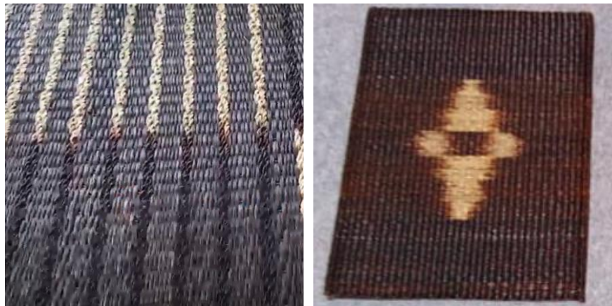
ภาพที่ 10 ตัวอย่างการสานแผ่นรองจานพื้นเกลียว

1.4 ด้านวัสดุที่ใช้ในงานจักสาน มุ่งองค์ความรู้เกี่ยวกับการเลือกใช้วัสดุและวัตถุดิบที่มีในพื้นที่และได้มาจากของที่เป็นธรรมชาติ วัสดุที่ชาวอีสานนำมาใช้งานจักสาน ได้แก่ ไม้ไผ่ หวายน้ำ หวายหางหนู พืชตระกูลกก ต้นธูป ต้นคล้า ผักตบชวา เถาวัลย์ และใบเตยหนาม ซึ่งผู้จักสานมีความชำนาญในการเลือกอายุของวัสดุที่เหมาะสมสำหรับนำมาจักสาน เช่น การจักสานที่ใช้ไม้ไผ่ หวาย ผักตบชวา ซึ่งเป็นวัสดุที่หาได้ในชุมชนนั้นๆ โดยไม่ต้องซื้อหาจากแหล่งอื่น น้ำมันยางและชันซึ่งได้จากต้นไม้นำมาทาเครื่องจักสานไม่ให้เกิดรอยร้าว เป็นต้น