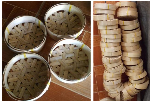
ภาพที่ 2 ตัวอย่างเครื่องจักสานที่เกี่ยวกับการบริโภค “แข่งปลาทุ”

1.2 ด้านรูปแบบของงานจักสาน มีองค์ความรู้ในการสร้างและพัฒนา รูปแบบของงานจักสานให้สอดคล้องตรงกับความต้องการของผู้ใช้งาน มีการประยุกต์และผสมผสานความทันสมัย ซึ่งเป็นพัฒนาการจากการจักสานแบบดั้งเดิมได้อย่างลงตัว และในบางชุมชนสามารถพัฒนาเป็นวิสาหกิจชุมชนได้ เช่น เครื่องจักสานหวายที่ทำเป็นชุดรับแขก การประยุกต์การสานครุ๋นน้ำในอดีตเป็นครุ๋นน้อย (มีขนาดเล็กกลง) และทำเป็นเครื่องประดับตกแต่ง ซึ่งการจักสานครุ๋นน้อยมีปรากฏเพียงแห่งเดียว คือ ที่บ้านสะอาง อำเภออุซันต์ จังหวัดศรีสะเกษ