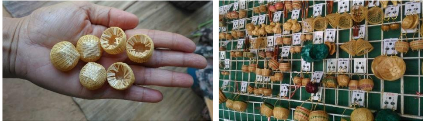
ภาพที่ 4 ตัวอย่างการประยุกต์การสานครุ๋น้อยและทำเป็นต่างหู

1.3 ด้านลวดลายงานจักสาน มีองค์ความรู้ในการออกแบบลวดลายงานจักสานตามความต้องการและเหมาะสมกับชิ้นงานนั้นๆ รวมถึงประโยชน์ที่จะใช้สอย และในบางชิ้นงานออกแบบเพื่อความสวยงาม แปลกตา ดังนี้