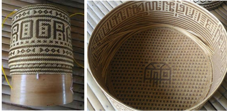
ภาพที่ 9 ตัวอย่างการสานกระติบข้าวเป็นลวดลายตัวอักษร

1.3.4 ลายประดิษฐ์หรือลายอิสระ เป็นลายที่ประยุกต์จากลายดั้งเดิม สานขึ้นตามความต้องการ เป็นลายที่เกิดจากจินตนาการ ความคิดสร้างสรรค์ที่อิสระตามความต้องการใช้สอย ทำลวดลายให้เกิดความสวยงามแปลกตา มีการย้อมสีวัสดุที่นำมาสานเพื่อให้เกิดสีสันและเห็นความแตกต่างของลายอย่างชัดเจน