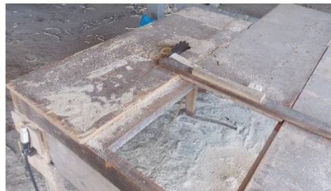
ภาพที่ 12 เลื่อยวงเดือนที่ประดิษฐ์เอง

1.6 ด้านการบำรุงรักษาเครื่องมืองานจักสาน มีองค์ความรู้เกี่ยวกับการดูแลรักษาอุปกรณ์และเครื่องมือที่ใช้ในการจักสานให้มีความพร้อมในการใช้งานและยืดอายุการใช้งาน มีวิธีการจัดเก็บและเช็ดทำความสะอาด เช่น การลับมีดเหลาตอกที่ใช้ในการสานให้มีความคมด้วยหินลับมีด การใช้น้ำมันทาเครื่องมือเพื่อกันสนิม