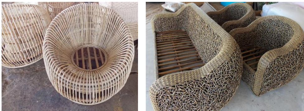
ภาพที่ 3 ตัวอย่างเครื่องหวายที่ทำเป็นชุดรับแขก

1.2 ด้านรูปแบบของงานจักสาน มีองค์ความรู้ในการสร้างและพัฒนา รูปแบบของงานจักสานให้สอดคล้องตรงกับความต้องการของผู้ใช้งาน มีการประยุกต์และผสมผสานความทันสมัย ซึ่งเป็นพัฒนาการจากการจักสานแบบดั้งเดิมได้อย่างลงตัว และในบางชุมชนสามารถพัฒนาเป็นวิสาหกิจชุมชนได้ เช่น เครื่องจักสานหวายที่ทำเป็นชุดรับแขก การประยุกต์การสานครุ๋นน้ำในอดีตเป็นครุ๋นน้อย (มีขนาดเล็กกลง) และทำเป็นเครื่องประดับตกแต่ง ซึ่งการจักสานครุ๋นน้อยมีปรากฏเพียงแห่งเดียว คือ ที่บ้านสะอาง อำเภออุซันต์ จังหวัดศรีสะเกษ