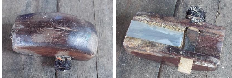
ภาพที่ 11 ตัวอย่างกบจักตอกที่ประดิษฐ์เอง

สานได้อย่างเหมาะสมและอำนวยความสะดวกในการทำงาน โดยใช้วัสดุที่หาได้ง่ายและเหมาะกับการจักสานในแต่ละขั้นตอน เช่น กบจักตอก เลื่อยวงเดือน เครื่องขัดไม้ เป็นต้น