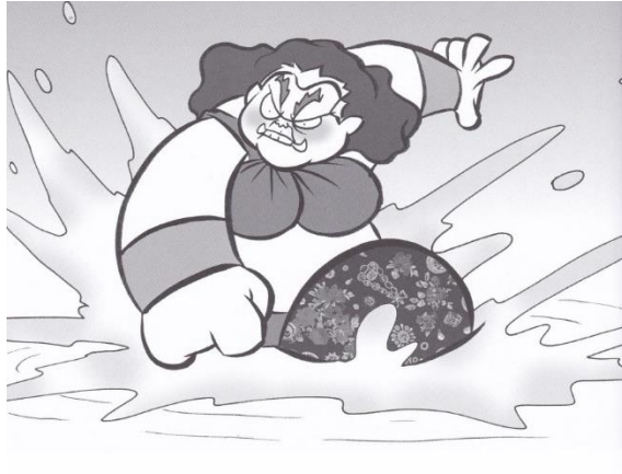
ภาพที่ 2 นางผีเสื้อสมุทรออกตามหาพระอภัยมณีด้วยความโมโห

หรือตอนที่นางผีเสื้อสมุทรผีเสื้อสมุทรออกตามหาพระอภัยมณีหลังจากที่ได้ไป จำศีลลดอาหารครบตามกำหนดเวลาแล้ว วรรณคดีฉบับการ์ตูนก็ได้แสดงอารมณ์ความรู้สึก ของนางผีเสื้อสมุทรที่ออกตามหาด้วยความโมโหผ่านภาพวาดดังต่อไปนี้