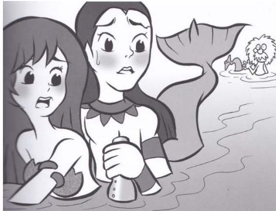
ภาพที่ 3 พระอภัยมณีและนางเงือกตกใจเมื่อรู้ว่านางผีเสื้อสมุทรตามมาทัน

ลักษณะและพฤติกรรมหลักตามที่ปรากฏในหนังสือเรียนวรรณคดีวิจักษ์ทุกประการ เพียงแต่ไม่ได้ให้รายละเอียดลักษณะและพฤติกรรมปลีกย่อยของตัวละครนั้นๆ เนื่องจากวรรณคดีฉบับการ์ตูนได้อธิบายลักษณะและพฤติกรรมปลีกย่อยของตัวละครผ่านการแสดงสีหน้าและท่าทางของตัวการ์ตูน ผู้อ่านจะเข้าใจลักษณะและพฤติกรรม ตลอดจนจนอารมณ์ความรู้สึกของตัวละครนั้นๆ โดยการดูจากภาพวาดแทน ดังเช่น ตอนที่พระอภัยมณีและนางเงือกตกใจเมื่อรู้ว่านางผีเสื้อสมุทรได้ตามมาทันแล้ว วรรณคดีฉบับการ์ตูนก็ได้วาดภาพเพื่อสื่ออาการตกใจของพระอภัยมณีและนางเงือกดังภาพต่อไปนี้