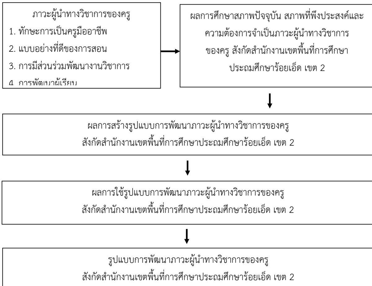
ภาพที่ 2 กรอบแนวคิดการวิจัย