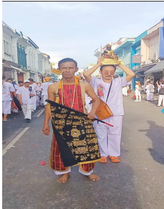
ภาพที่ 1 ภาพม้าทรง