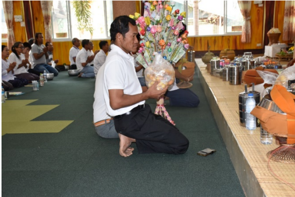
ภาพที่ 2 กลุ่มเป้าหมายถวายภัตตาหารก่อนการเสวนาทางวิชาการ

ปฏิบัติต่อบุคคล ต่อธรรมชาติ และต่อสิ่งเหนือธรรมชาติอย่างถูกต้องและจริงใจ อีกทั้งเข้าใจว่าสังคมใจงาม หมายถึง สังคมที่ผู้คนมีสำนึกในคุณธรรม จริยธรรมและค่านิยมที่ดีงาม ไม่เรียนรู้ ตัดสินใจด้วยความระมัดระวังในการเสริมสร้าง ครอบครัว ชุมชนที่มีค่านิยมร่วมกันโดยยึดหลักผลประโยชน์ส่วนรวม อยู่ร่วมกันอย่างสันติสุข ระหว่างกลุ่มคน ระหว่าง พื้นที่ และระหว่างวัย พี่งพอาอาศัยและเอื้ออาทรเกื้อกูลกันและแบ่งปัน ภายใต้ความแตกต่างหลากหลายความคิด เข้าใจ ถึงคุณลักษณะชุมชนการวะตะธรรม 8 ประการตลอดระยะเวลาเดือนมกราคม 2562 ณ วัดโศกการาม