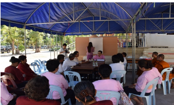
ภาพที่ 3 การสนทนากลุ่มย่อยของกลุ่มเป้าหมายและคณะผู้วิจัย