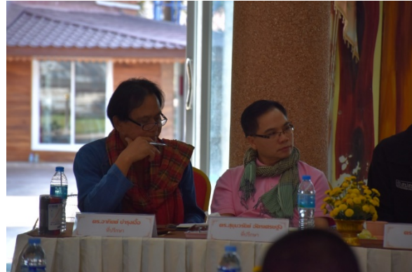
ภาพที่ 2 การเสวนาทางวิชาการชุมชนการวะตะธรรม