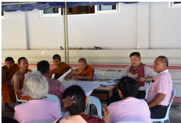
ภาพที่ 5 คณะผู้วิจัยและกลุ่มเป้าหมาย ร่วมออกแบบกิจกรรมกลุ่ม

8. กิจกรรมคุณลักษณะชุมชนคารวะตะธรรม ประการที่8 คือใจงาม ได้แก่การปลูกผักด้วยรักและแบ่งปัน พันธุ์ การเลี้ยงไก่ดำปันพันธุ์ การลงแขกเกี่ยวข้าว นวดข้าว เครือข่ายควายแบ่งปัน เครือข่ายปันพันธุ์ข้าว เครือข่าย ความเป็นธรรมเครือข่ายครอบครัวบ่มเพาะศีลธรรม คุณธรรม เครือข่ายค่ายจิตอาสา เครือข่ายคนพอเพียง เครือข่ายคนฮักถิ่น เพื่อการขับเคลื่อนกิจกรรมทำให้กลุ่มเป้าหมายดำเนินวิถีชีวิตด้วยความมีใจงาม