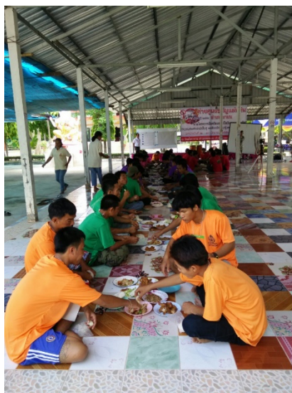
ภาพที่ 1 เคารพกันผ่านพาข้าว(สำหรับอาหาร)